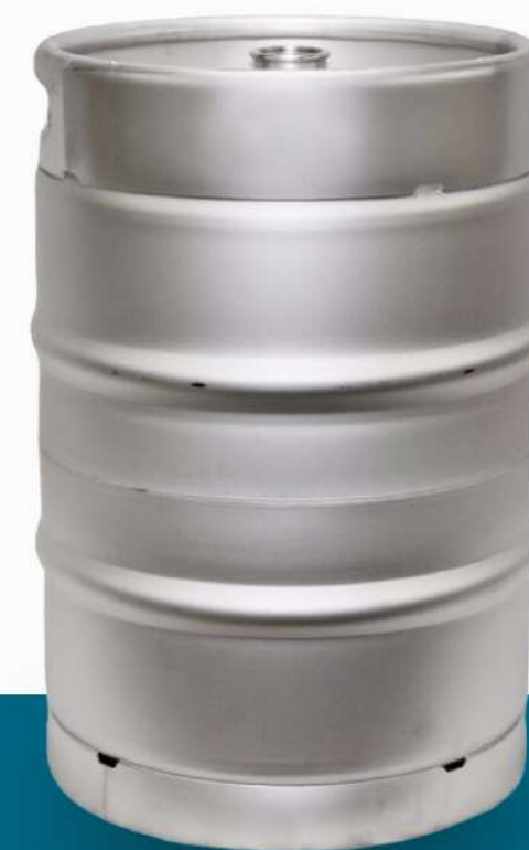
Контроль герметичности фитинга