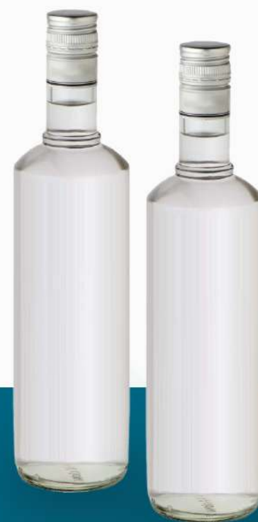
Контроль уровня налива