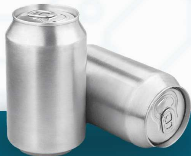
Контроль даты на продукте

Решения с применением технологий машинного зрения, ИИ и нейросетевых алгоритмов